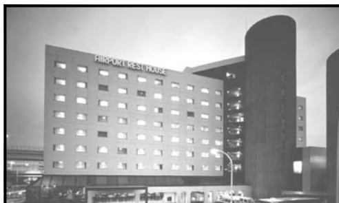
Narita Airport Rest House

風光豊かな歴史の街カンタベリー。ロンドンの東南方にゆったり広がるケント地方はイングランドの庭園と呼ばれています。景色が素晴らしいばかりではなく、肥沃な土壌と温かな気候に恵まれて、古くはローマ人の時代から栄えていました。カンタベリーはイギリスで最もキリスト教が栄えた地で、603年に初代大司教を迎えて以来、現在のランツ師が102代目という英国国教会総本山カンタベリー大聖堂のある街です。